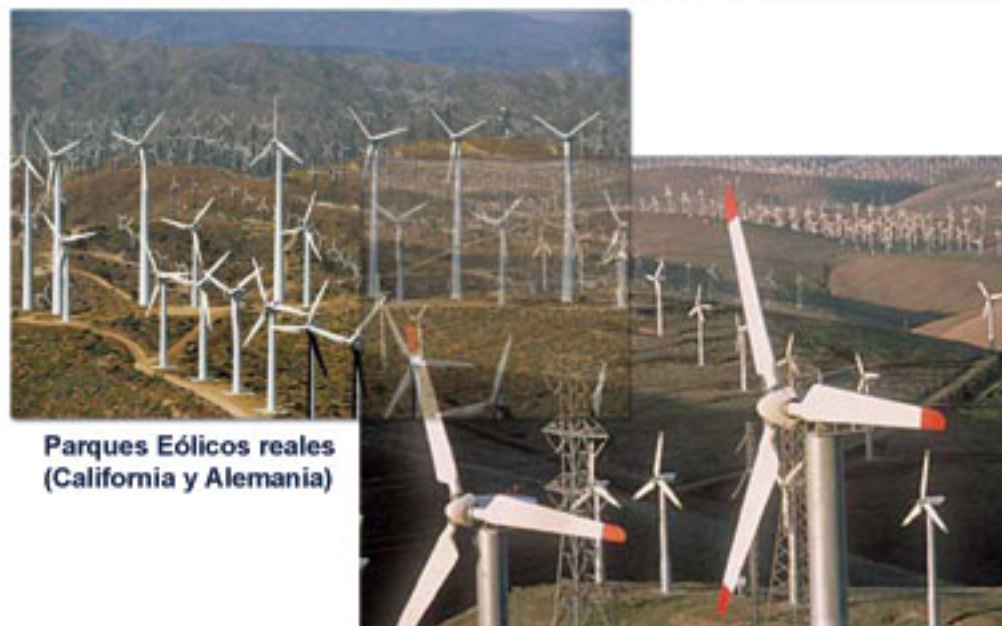
Parques Eólicos reales (California y Alemania)