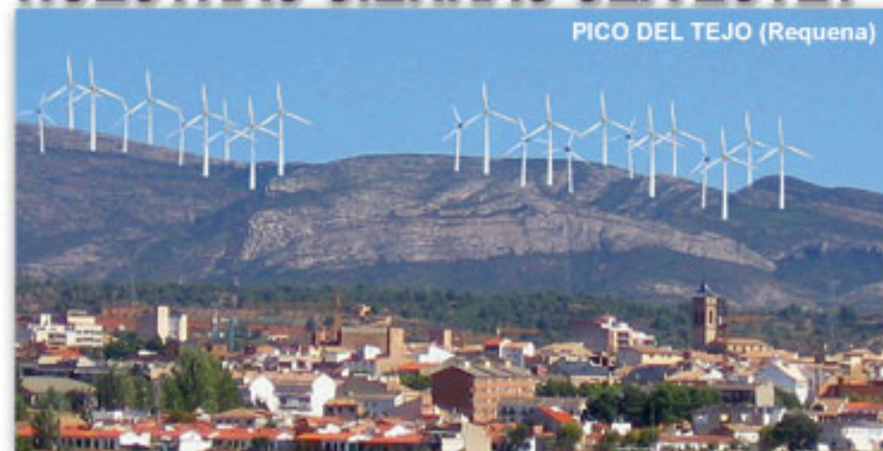
PICO DEL TEJO (Requena)

ENERGÍA EÓLICA SÍ, PERO NO A CUALQUIER PRECIO.