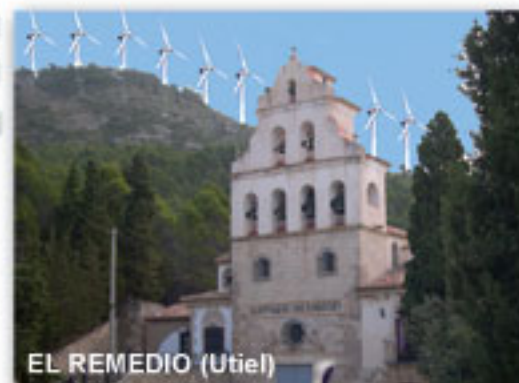
EL REMEDIO (Utiel)

¿QUIERES QUE EL FUTURO DE NUESTRAS SIERRAS SEA ESTE?